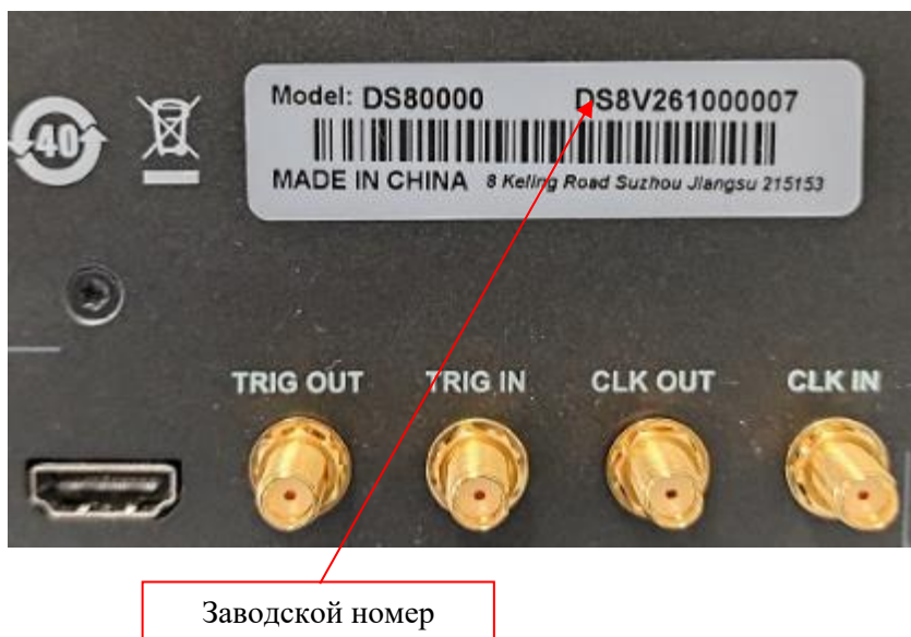
Рисунок 3 – Фрагмент задней панели осциллографов RIGOL DS80000 с этикеткой