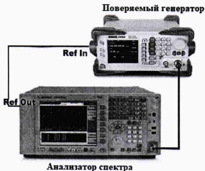
Рисунок 1 – Схема соединения приборов для определения погрешности установки выходного уровня генератора от -110 до -40 дБм

7.5.3 Далее – собрать схему, представленную на рисунке 1.