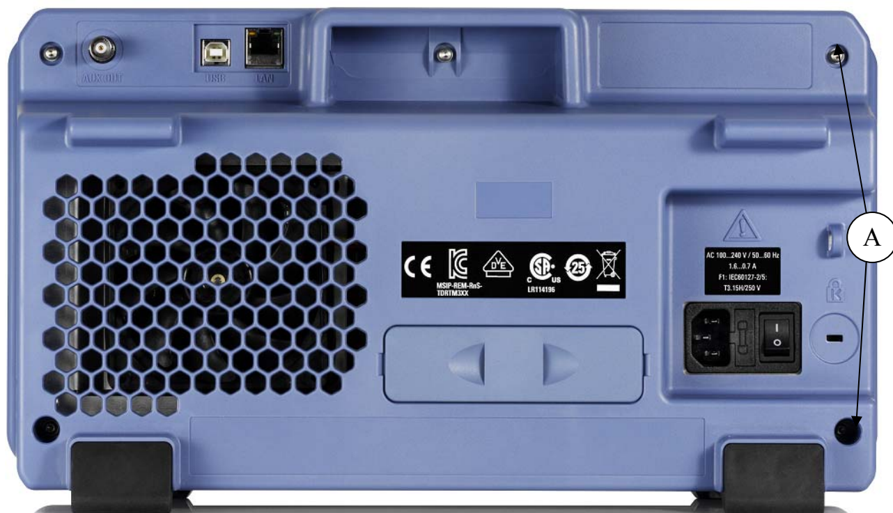
Рисунок 2 - Схема пломбировки от несанкционированного доступа (А)